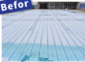
プールの床が蓋になって、この下に水が入っています。プールを使用しない時期は、災害時の貯水施設として使用しています。