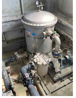
こんなに大きな過装置もあり、常に水がキレイな状態に管理されています。