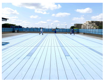
キレイに清掃されたプールを見回り点検していきます。

可動式プールは、点検ポイントがたくさん! 取材の日も、緩んだネジを一本一本締め直したり、床下に入って点検するなど、本当に細かい点検作業をしていました。たくさんのおかげで安心安全なプールが保たれています。