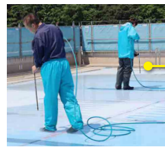
床下の水を抜いて、床を高圧洗浄でキレイにしていきます。