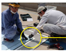
足をケガしないよう緩んだネジを一本一本締め直していきます。