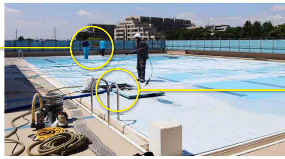
洗浄後の床下の汚水はポンプで吸い上げ排水します。これでしっかりキレイに!